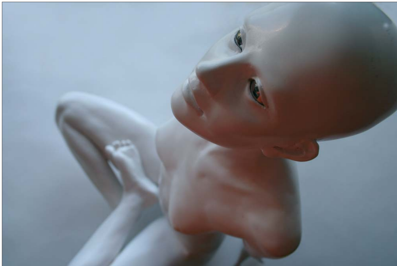
Levitace II, 2005, polyesterový gel, nerezová ocel, výška 47,5 cm.