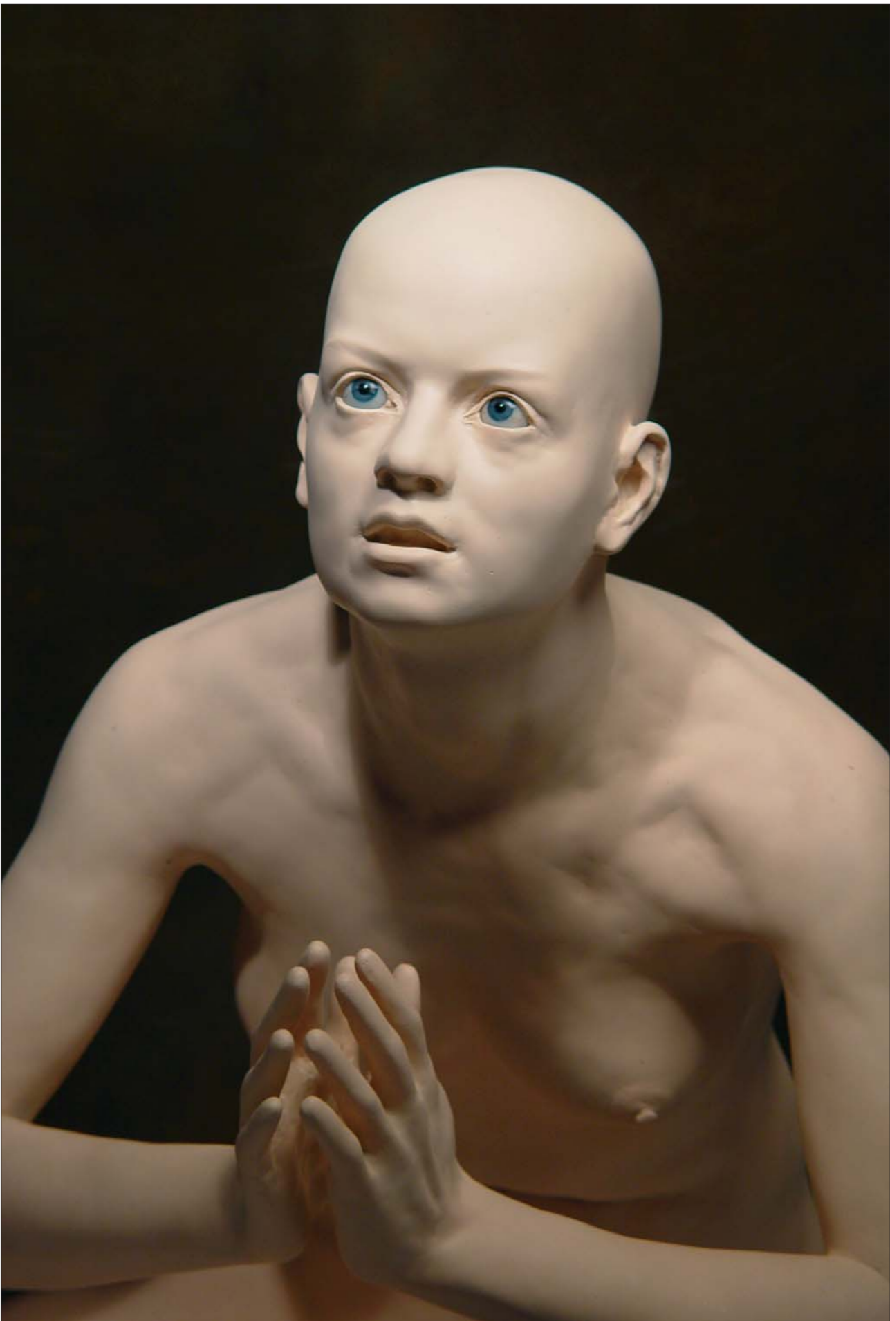
Extáze, 2001, polyester, sklo, ocel, výška 104 cm.