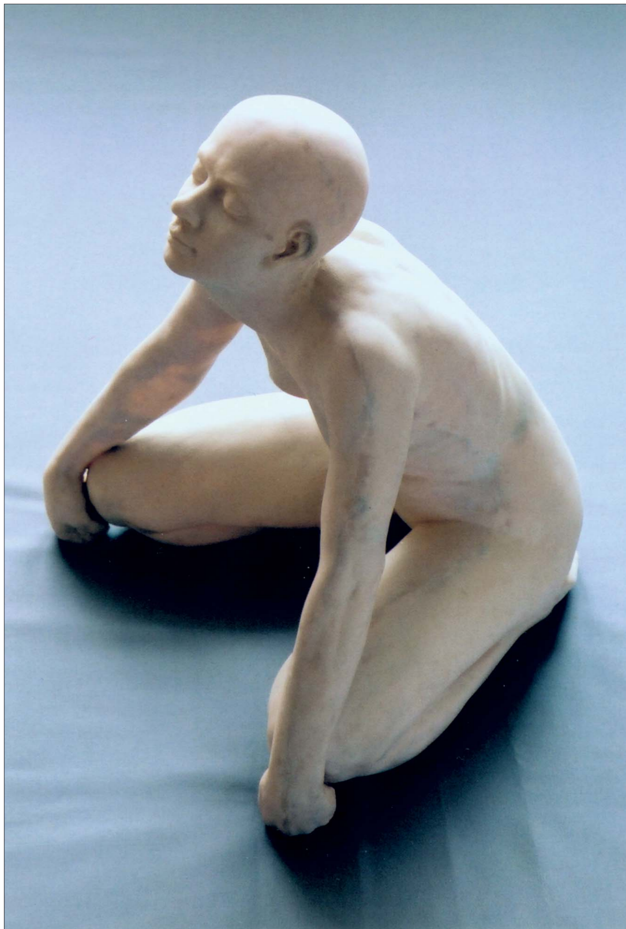
Meditace II. 2000, polyester, fosforescentní lak, výška 40 cm.